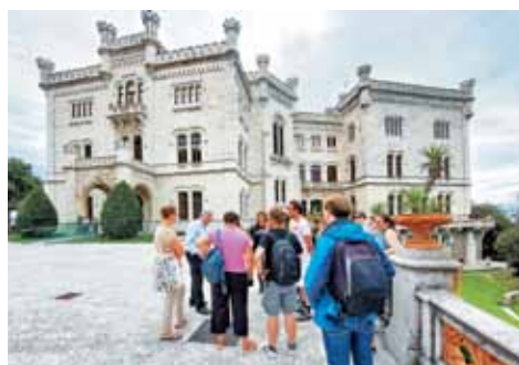
Brez obiska slovitoga gradu Miramar v bližini Trsta ni šlo.