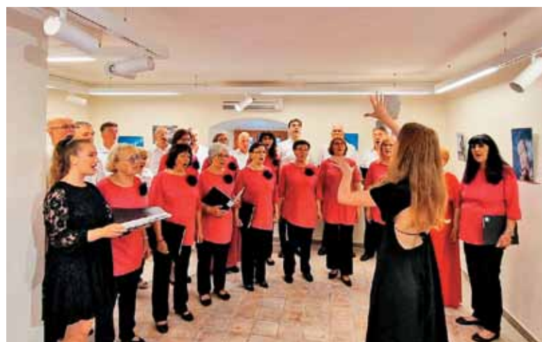
Nastop Encijana v galeriji