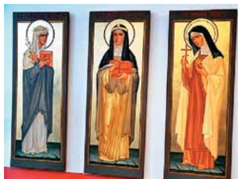
Tri zavetnice Evrope: sveta Katarina Sienska, sveta Brigita Švedska in sveta Edith Stein v novi kapeli