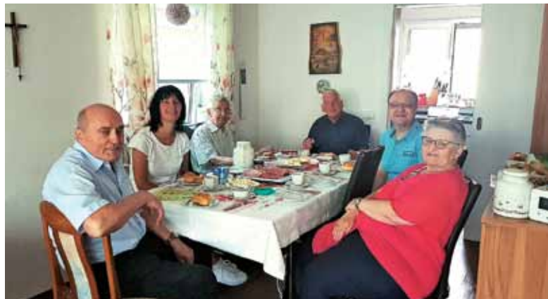
Na srečanju pri gospe Mencin