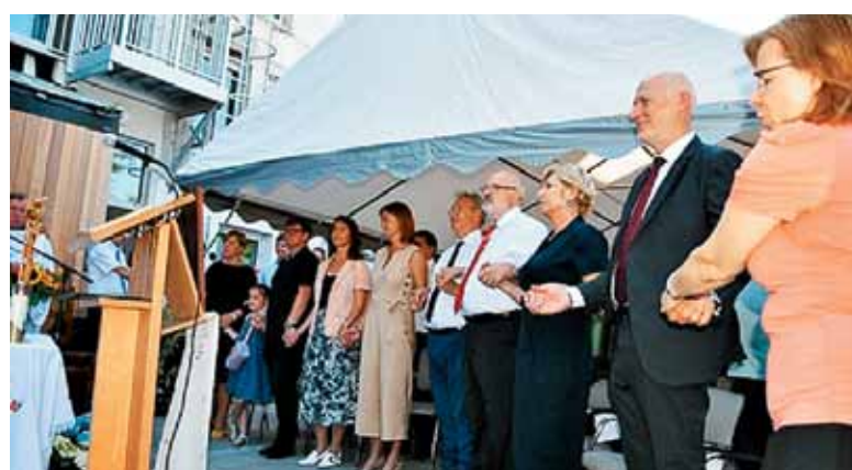
Med očenašom pri maši za domovino ob odprtju prenovljenega SPC

hova vzgoja, njihova duhovna rast. Medgeneracijski dialog, vzgoja za vrednote, vzgoja za dialog in odprtost, široka izobrazba in ob njej kulturna srca, to so izzivi za prihodnost. Da, v Bruslju se imamo radi in to pokažemo pri vsaki maši, ko se pri molitvi očenaša primemo za roke in jih dvignemo visoko kvišku ter vzkliknemo: »Tvoje je kraljestvo, tvoja je oblast in slava vekomaj!« Naj bo tudi tak lep in veličasten dogodek, kot je bilo slavnostno odprtje prenovljenega Slovenskega pastoralnega centra, v slavo in čast Kristusovega Božjega kraljestva.