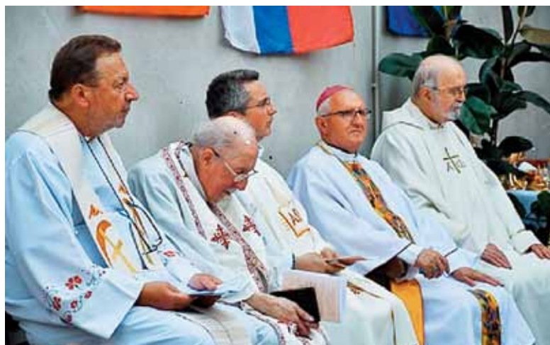
Duhovniki z nadškofom ob odprtju prenovljenega SPC v Bruslju