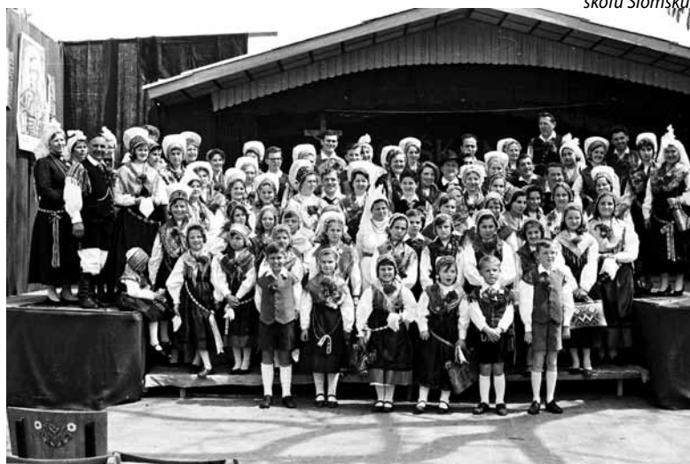
Narodne noše so obarvale slovesno proslavo Slomškove stoletnice smrti.