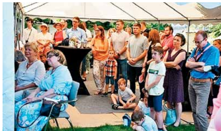
Del občestva med mašo za domovino ob odprtju prenovljenega SPC