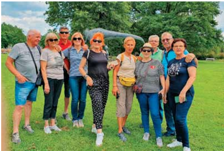
Člani društva v Arboretumu Volčji Potok