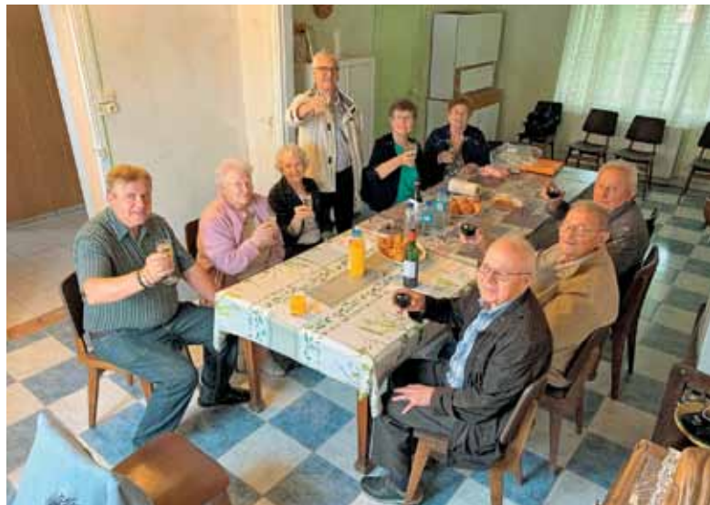
Zadnje julijsko srečanje v Mericourtu po maši in pred počitnicami

Prvega julija smo pred počitnicami še zadnjič imeli mašo ter srečanje po njej v Mericourtu. Število naših rojakov se vrtilo okrog števila