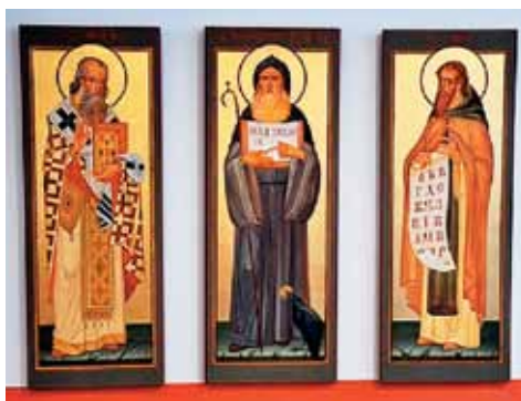
Ikone treh zavetnikov Evrope - sv. Benedikt, sveta Ciril in Metod

Pod tem naslovom je Pogačnik intervjuval mene kot voditelja Slovenskega pastoralnega centra. V kratkem pogovoru sem prikazal izzive krščanske in katoliške skupnosti v velikih in kozmopolitskih mestih, kot so Bruselj, Luksemburg, Haag in Pariz. V ospredje pastore stopajo predvsem mlade družine in otroci, nji-