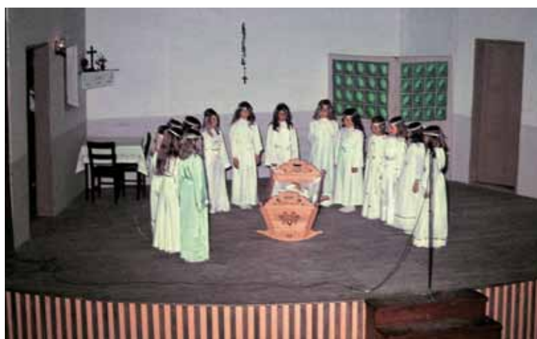
Angelčki ob zibelki novorojenca izbirajo, kdo mu bo za angela varuha.