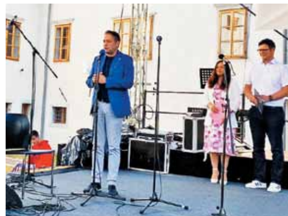
Minister je v svojem govoru dejal, da bi se Slovenci morali zavedati svoje izjemnosti.