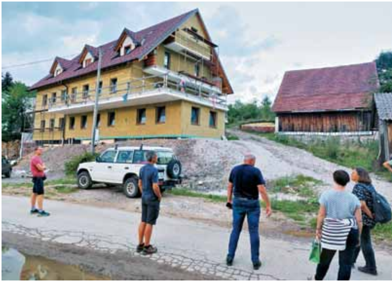
V Prezidu bo kmalu zaživela slovenska vzorčna kmetija.