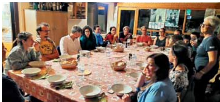
Prva večerja v Gornjih Poljanah