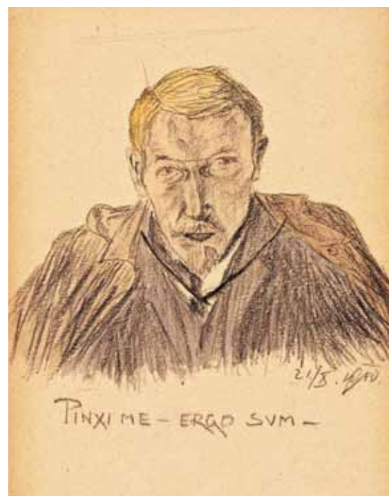
Pinxi me, ergo sum-Avtoportret

Descartesov izrek Cogito ergo sum (Mislim, torej sem) je Župančič nekoliko humorno parafraziral in