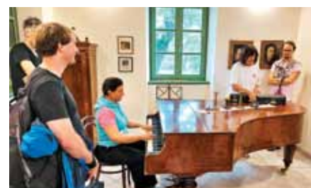
Za zaključek, obisk Kosovelove domačije v Tomaju