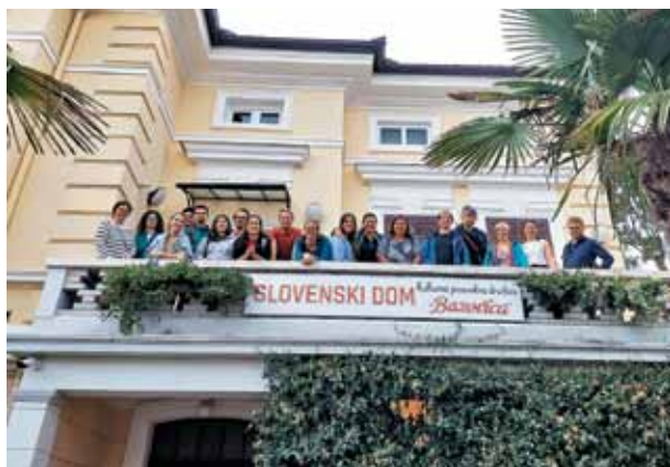
Na obisku pri Slovencih na Reki