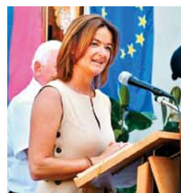
Zunanja ministrica RS Tanja Fajon je navzočim čestitala ob prazniku slovenske državnosti.