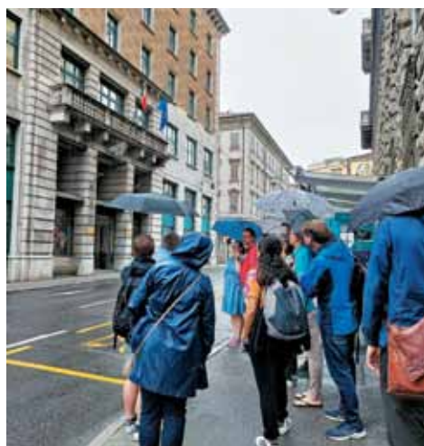
Narodni dom v Trstu