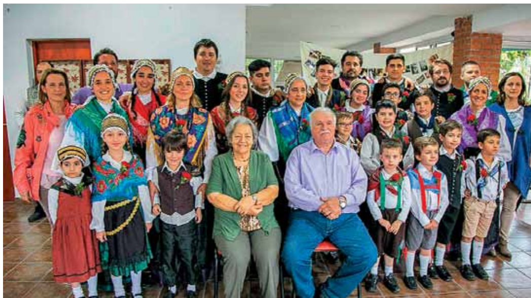
Družinska fotografija ob 50-letnici zakona