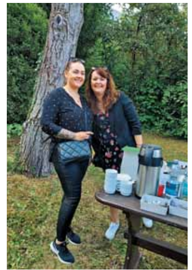
Mlade Slovenke pomagajo pri slovenski prireditvi.

Božjem kraljestvu vzamejo k srcu in temu primerno usmerjajo svoja dejanja (prim. Mt 5,1-16). Zavzemanje za mir, pravičnost in ohranjanje stvarstva zaznamuje delovanje Cerkev v smislu globalne odgovornosti. Kot Cerkev vnašamo svetopisemske perspektive v družbeno razpravo. Skupno z vladnimi in nevladnimi organizacijami se kristjani zavzemamo za pošten, miren, pravičen in za življenja vreden svet.