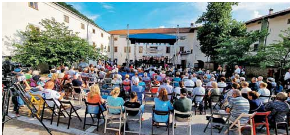
Na odru so se zvrstili nastopi skupin iz zamejstva in izseljenstva.