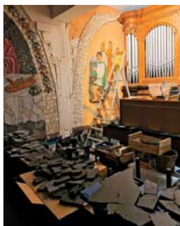
Za nekaj dolgih tednov je del kapele zopet delovišče ...

kan Frank Wentzinger, predsedniki društev in gostje poslovili od nje-ga. Hitro smo se odpeljali v mlin, kamor sta prvič stopila in kjer sta v osebni pogovoru izmenjala z duhovnikom poglede na preteklost in seveda tudi preresetala načrte naše bodočnosti. V spominu jima bo nedvomno ostal Habsterdick in Merlebach kot izrazito bogata slovenska srečanja. Po kavi še čas za skupni posnetek in diplomatsko vozilo je že odpeljalo visokega gosta v Strasbourg, kjer so ga ob 18. uri čakale druge obveznosti. Hvala vam za vs