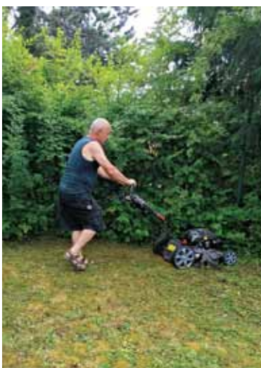
Ciril kosi na slovenskem vrtu.

Cerkev z ljudmi deli veselje in upanje, žalost in strah. Kristjani zaznavajo znamenja časa in jih razlagajo v luči evangelija. Prizadevajo si za