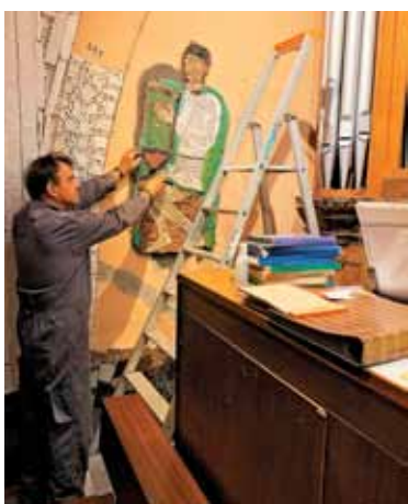
Njegova zamisel je bila, da ob orglah nastanejo iz mozaikov trije godci.