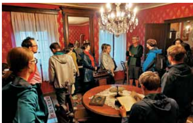
V eni izmed čudovitih sob Palčave šiše v Plešcah