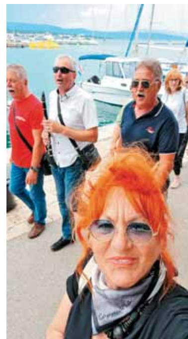
... in veseli Encijančki