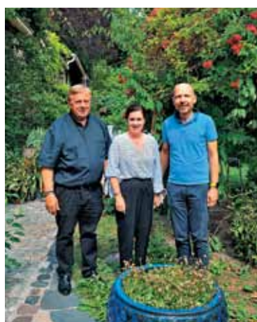
Zadnja postaja je bil obisk mlina, kjer se je trojica zadržala na skupnem kosilu.