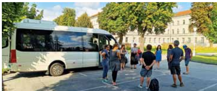
Pred odhodom, pri Zavodu sv. Stanislava v Šentvidu