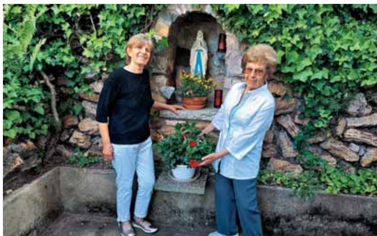
Prekmurki pri slovenski kapeli

Jezus mlade povabi k sebi, jim namenja pozornost in ceni, kako sprejemajo sporočilo evangelija (prim. Mr 10,13-16). Bog spremlja ljudi od začetka njihovega življenja. Krščansko sporočilo otrokom in mladim omogoča, da razvijejo versko identiteto.