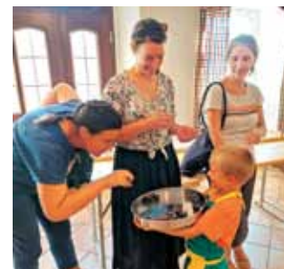
Degustacija lokalnih izdelkov v Prezidu