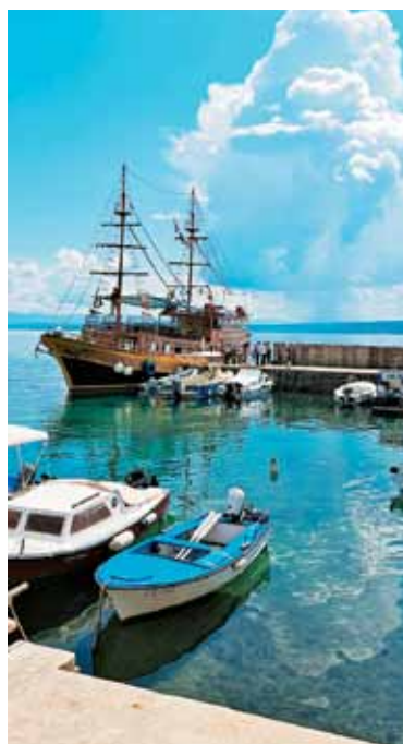
Izlet z ladjo na otok Krk ...