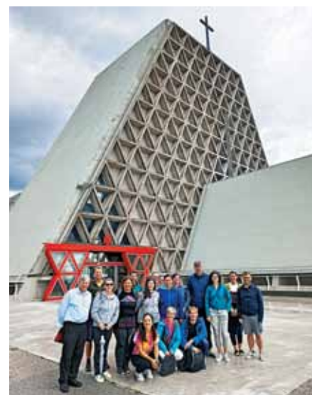
Pred ekstravaganantnim Marijinim svetiščem na Vejni