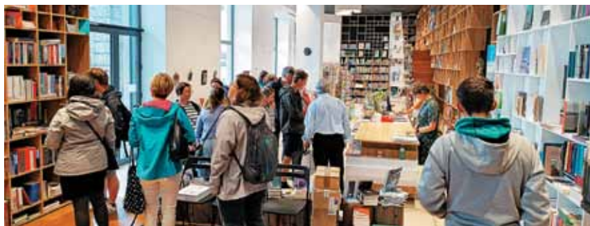
V sodobnem Tržaškem knjižnem središču