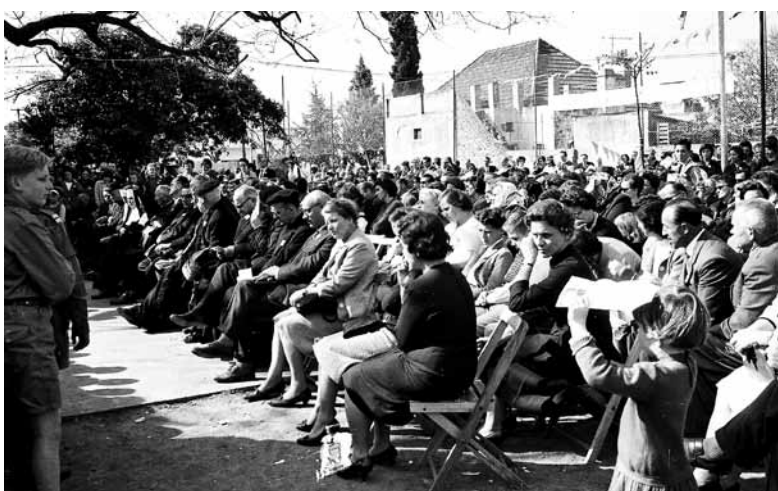
Zelo veliko rojakov se je udeležilo proslave ob stoletnici smrti škofa Slomška.