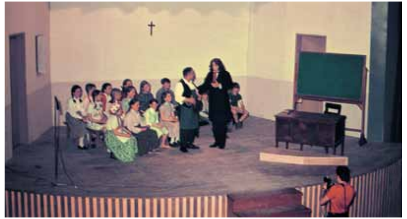
Med šolsko uro učitelj sporoča učencem veselo novico, da je njihov rojak postal škof.