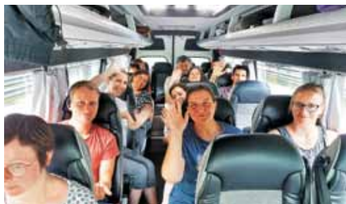
Kljub slabim vremenskim napovedim dobre volje ni manjkalo.