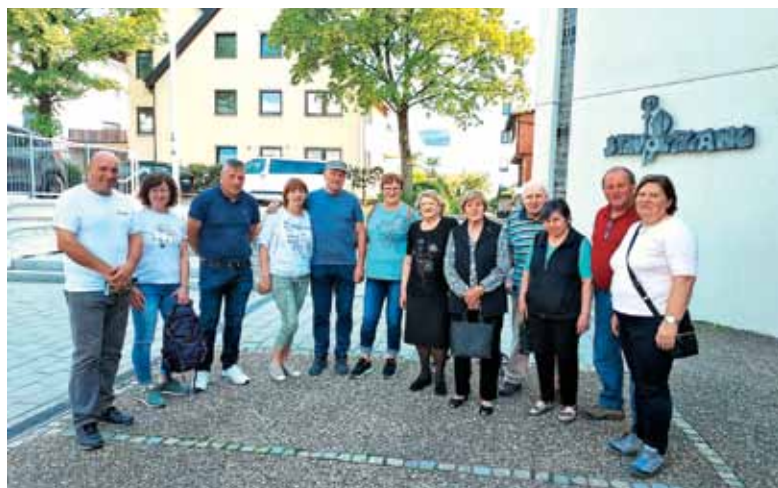
Slovenci v Pfullingenu