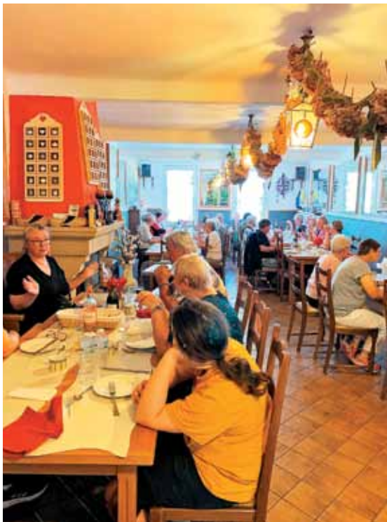
11. junija smo se pred poletnimi počitnicami še enkrat dobili na skupnem kosilu.

je vodil tudi romanje v Habsterdicku. Dober dušni pastir in zagret čebelar nam je obljubil, da bo v bližnji bodočnosti tudi osebno obiskal Slovenijo. Z njim sem se podal na pot duhovnega spremljanja vseh migrantov škofije Metz. Bog naj še naprej obilno blagoslavlja njegovo delo.