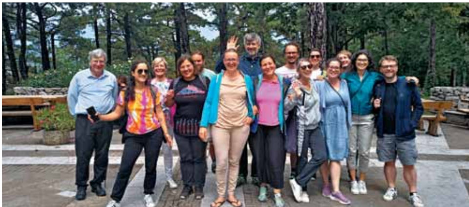
Kljub temu da nam je vreme preprečilo vzpon na Svete Višarje, nas dobra volja ni zapustila.

v Tomaju na Kosovelovi domačiji in poslušali o Kosovelovi družini ter seveda o Srečku, ki je na domačiji preživel svoje zadnje dni.