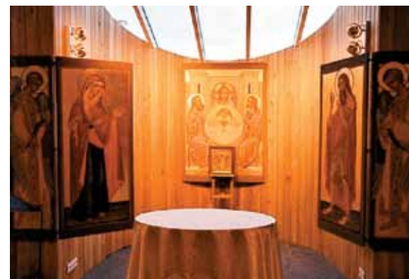
Osrednja ikona Jezusovega razodetja v Emavsu v novi kapeli

evropskega parlamenta in evropske komisije. Gostoljubje je zaščitni znak Slovenskega pastoralnega centra, saj tu najdejo svoj drugi dom številni študentje, ki v Bruselj prihajajo na študijsko izmenjavo ali so stažisti pri slovenskih evropskih poslancih. V kozmopolitskem mestu, v Bruslju, lahko najdejo košček domovine prav v druženju v Slovenskem pastoralnem centru, kjer se zbirajo številni Slovenke in Slovenci, ki so stalno ali začasno zaposleni v različnih evropskih institucijah.